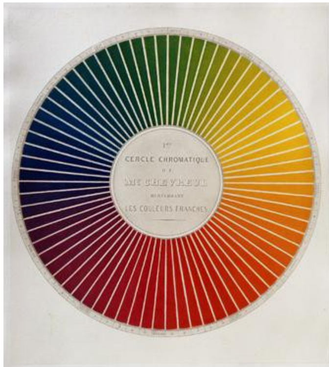
Michel Eugène Chevreul, Le cercle chromatique