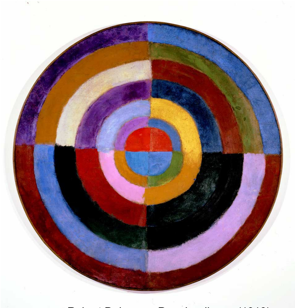
Robert Delaunay, Premier disque (1913)