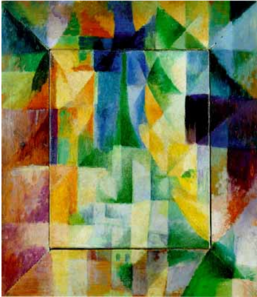
Robert Delaunay, Les fenêtres simultanées (1912)