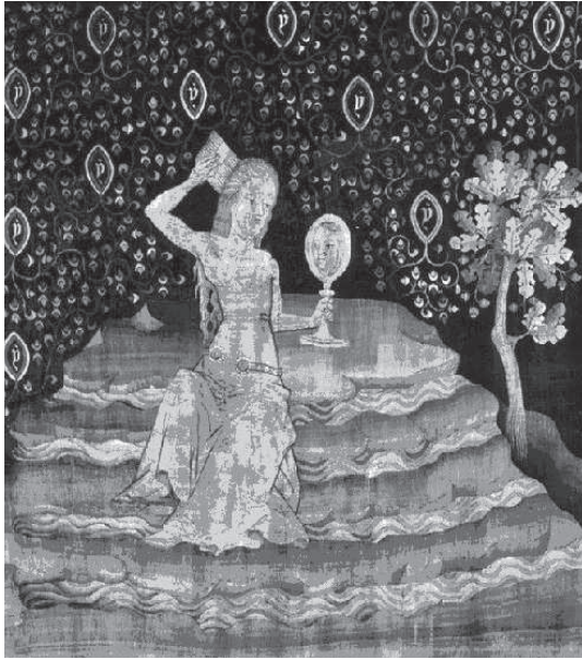
2. Jean Bondol, Tapiserie apocalyptique (particolare: La grande prostituée , XIV sec.), Chateau d'Anger. Venere, un modello di conoscenza alternativa.

radice, dunque all'origine, al Tutto e Uno da cui, monocausalmente, scaturisce ogni conoscenza. Venere invece è interpretata come un intricato fogliame che – per disseminazione – senza un motivo o una direzione apparenti si allarga su tutti lati. Questo albero della vita professa figurativamente la propria appartenenza all'“anima vegetativa”. Ciò che gli preme è la pienezza procreativa, il prosperare della vita, non un determinato adempimento. Il suo interesse non riconosce alcun criterio stringente di ordinamento; si compiace piuttosto di tutto ciò che è rigoglioso, lussureggiante, irregolare; e si riproduce incessantemente, rendendo quindi