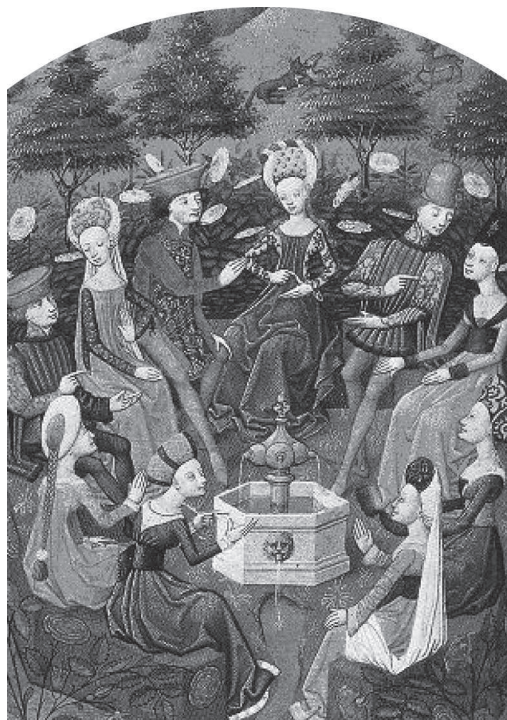
3. Prima pagina delle Cent Nouvelles Nouvelles , prima traduzione francese del Decameron a cura di Laurens de Premierfaict (1414) (Parigi, Bibliothèque nationale de France, Fonds Français, ms. 129).

del singolo caso, ma contemporaneamente lo commenta. A ciò il Decameron deve la sua seconda, esemplare unità strutturale: anche il senso delle storie narrate diventa oggetto della narrazione. Ma a differenza di quanto accade nell'esegesi dei testi religiosi, o nella moralizzazione di quelli letterari (come ad esempio nell' Ovid moralisé ), Boccaccio accetta l'azzardo di rappresentare l'umano-troppo umano in tutta la sua crudezza, senza tentare di appianarlo secondo il senso e la ragione prescritti. Lascia invece che siano i membri della brigata a consultarsi sul caso, di modo che, in linea di massima, il suo significato risulta soltanto dalla loro interpretazione 33 , è quindi frutto di una concertazione comune (fig. 3). Di conseguenza, i concetti d'ordine, seppur recepiti come indispensabili, non sono più sentiti come semplici imposizioni esterne: la brigata statuisce un audace esempio di moralità autonoma. Attenendosi ad essa, i valori virtuosi vanno collaudati in un libero processo di intesa. Ancora una volta Venere, con la sua mentalità generativa, sembra aver fatto da madrina: essa vuole infatti che la vita si mantenga vitale e non dottrinarmente irrigidita. In tal modo, l'esistenza contingente non è più tacciata di peccaminosità. Un comportamento fallibile può essere accettato sul piano umano, a condizione che venga adeguatamente trattato su quello linguistico.